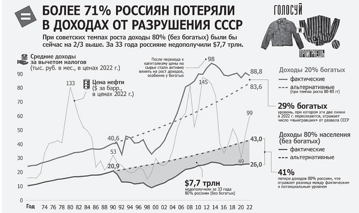
Примечания: 1) приведены среднедушевые располагаемые доходы (за вычетом налогов и др. обязательных платежей) в ценах 2022 г.; 2) альтернативный (советский) уровень доходов — тот, что сложился бы при средних за 1980-1989 гг. темпах прироста (+2,28% ежегодной); 3) потери доходов — разница между потенциальными показателями и фактическими; 4) доходы за 1991-1995 гг. приведены по сопоставимой средней величине инфляции в эти годы.