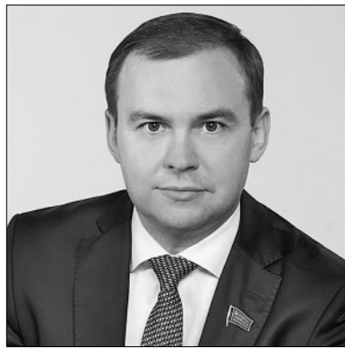
Первый заместитель Председателя ЦК КПРФ Юрий Афонин принял участие в программе «60 минут» на телеканале «Россия 1».

Главной темой программы стали успешное продвижение российских войск в Соледаре. Юрий Афонин отметил, что взятие Соледара будет иметь большое морально-психологическое значение. Украинская экономика сейчас существует только за счёт западных поставок. Российские удары высокоточным оружием разрушают инфраструктуру на подконтрольной киевскому режиму территории. ВСУ несут огромные потери.