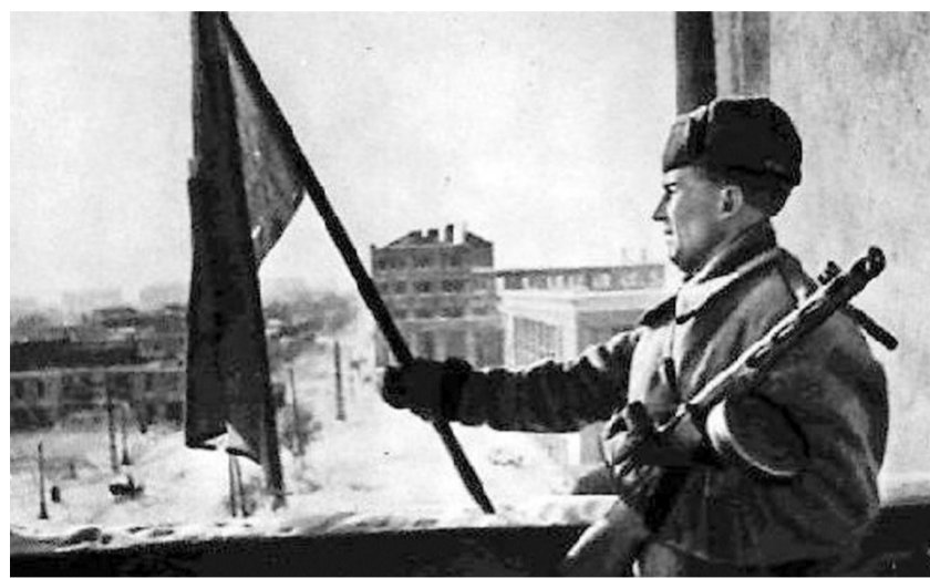
Уважаемые воронежцы, ветераны, труженики тыла!

Поздравляем Вас с 80-й годовщиной освобождения г. Воронежа от немецко-фашистских захватчиков!