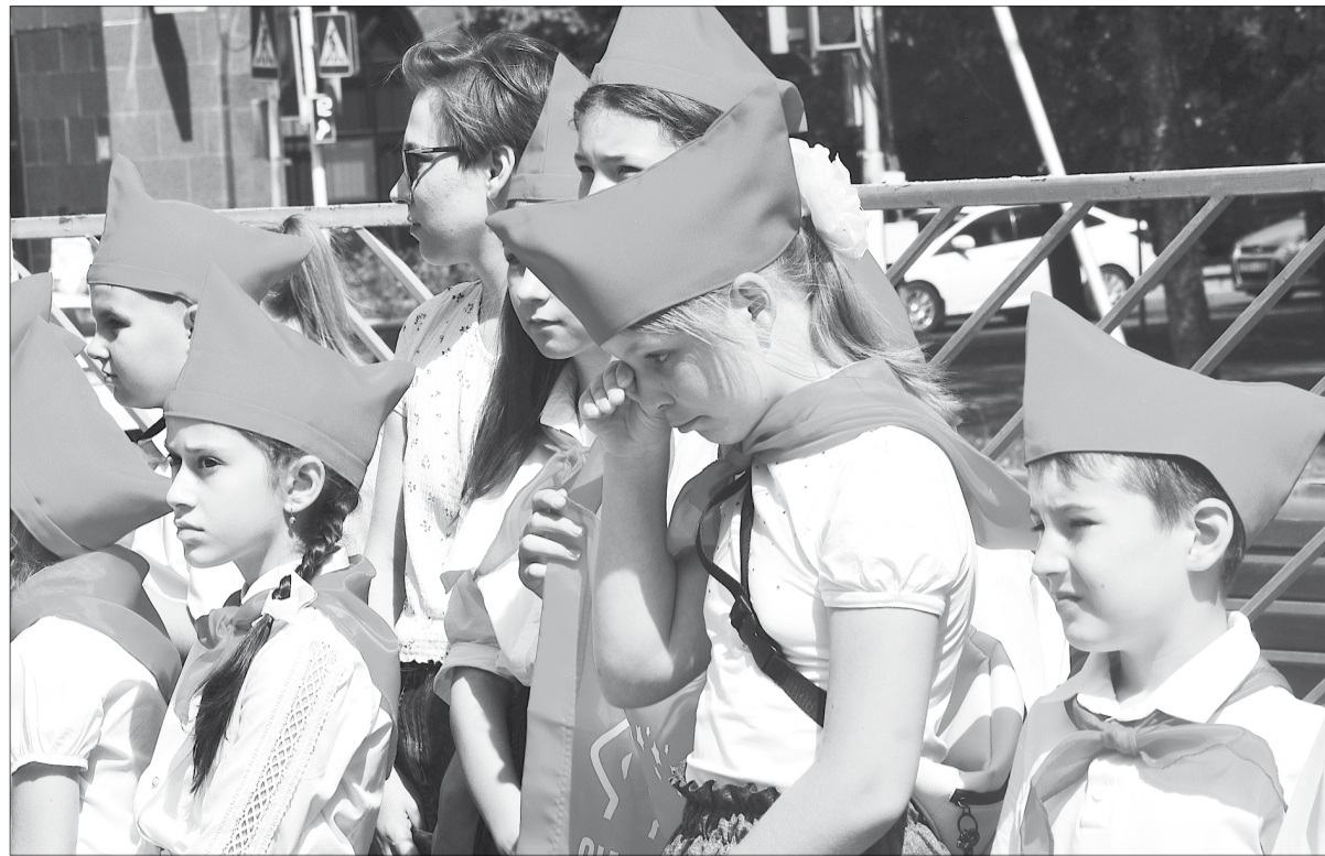
Организаторы акции ставили перед собой задачу воспитания, формирования общественного сознания и гражданской позиции у подрастающего поколения...

Веру в победу над терроризмом поддержали показательные выступления ребят из военно-патриотического клуба «Беркут».