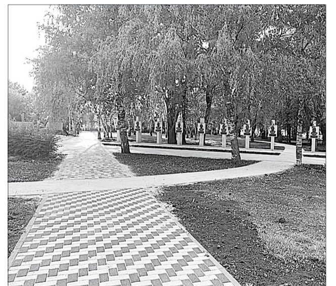
Информация из открытых источников.

Городские озеленители высадят в сквере около сотни саженцев туи, магнолии и можжевельника, появятся клумбы с яркими бархатцами и петуниями, рассказали в администрации города.