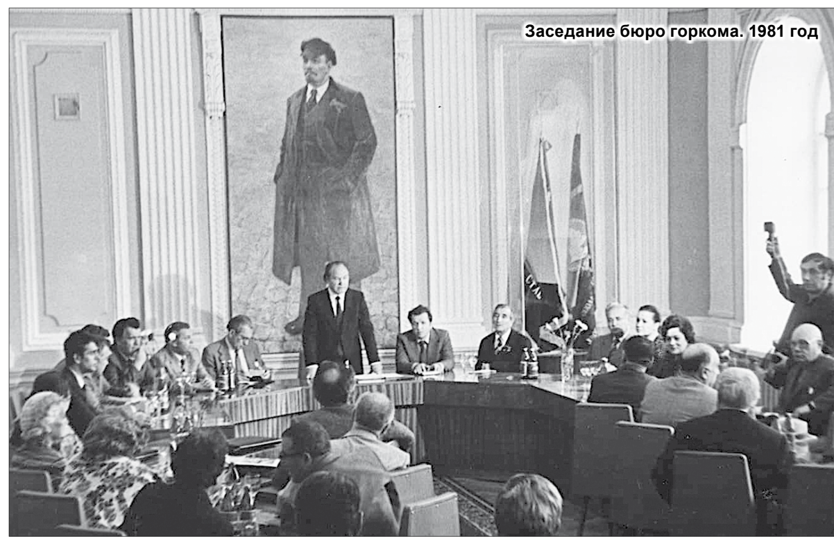
Заседание бюро горкома. 1981 год

ла мать - добротой, трудолюбием, справедливостью. Она была глубоко верующим человеком, но никому не навязывала свою веру и просила не вмешиваться, говорила: «Я же в ваши дела не вме-