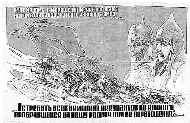
Истребить всех немецких оккупантов до единого, провалявшихся на нашу родину для ее порабощения.

Разумеется, есть. При помощи хитрых информационно-психологических манипуляций можно привить народу комплекс исторической неполноценности. Заставить его ужаснуться и отречься от собственной истории, деяний своих предков, а значит, и от идеи необходимости сохранять государственность. Морально сложенный, раздвоенный народ, отрёкшийся от отеческих гробов, неизбежно будет каяться и искать спасение у чужеземцев, чья история не замарана «чужовищиными» преступлениями. Он заочно «пригласит на княжение» «мудрых варягов» и будет беспрестанно исполнять всё, что ими будет приказано.