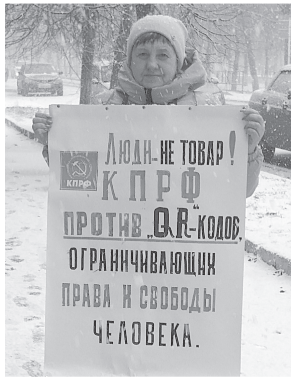
Только вместе мы можем противостоять этому безумному попиранью наших конституционных прав!

Обращаюсь с просьбой к жителям нашей области. Если у вас есть возражения или дополнения к этим законопроектам, направляйте их депутатам от «Единой России» Государственной Думы. Именно они пытаются принять решение за вас, а мы, депутаты от КПРФ, всегда с вами! Требуйте от них, чтобы при рассмотрении этих законопроектов они руководствовались в том числе и вашим мнением, а не только распоряжением вышестоящего партийного руководства и навязчивым желанием Правительства РФ.