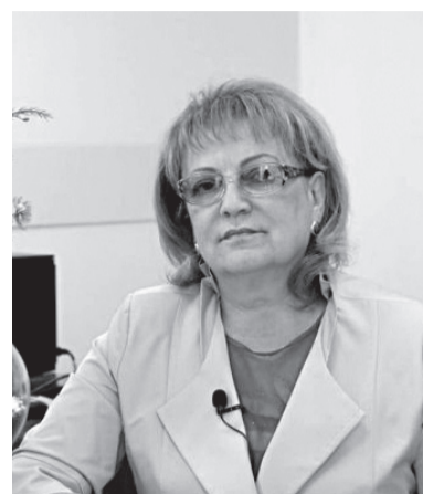
Теперь понятно, почему власть не хочет заниматься стаями бродячих собак.