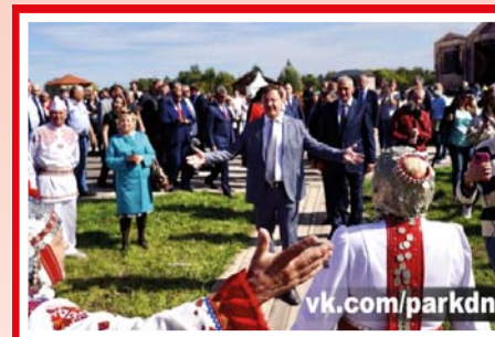
Губернатора и его свиту развлекали на должном уровне

Экспонаты привозились со всей России. «В домах выставлены экспонаты, рассказываю-