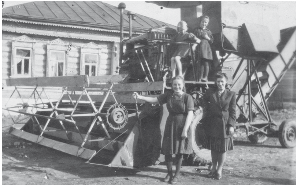
18 сентября 1929 года на Запорожском заводе «Коммунар» выпустили первый отечественный прицепной комбайн. Первые самоходные комбайны появились в СССР в 1947 году. По количеству комбайнов Советский Союз лидировал с конца 1960-х.

С сельхозтехникой «прорыва» пока не видно. Отсюда те же проблемы и с уборкой овощей, цена на которые так всех удивила ушедшим летом, и даже сам президент велел заняться снижением их стоимости. Но с чего бы ей снизиться?