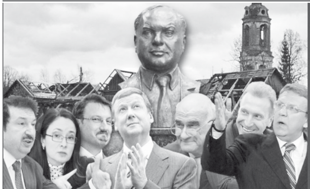
Российская рыночная экономика