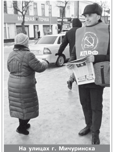
На улицах г. Мичуринска

В праздничные дни марта кирсановские товарищи охватили агитацией значительную часть города Кирсанова и пригород. Активисты Уваровского РК КПРФ вместе с экземпляром газеты вручали представительницам прекрасного пола цветы. Члены Мичуринского горкома партии вышли с поздравительным номером «Нашего голоса» в центр города. Партийный актив и местное отделение ООД «ВЖС» в Инжавинском районе поздравили с 8 Марта женщин-ветеранов партии.