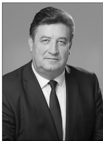
Виктор Иванович ГОНЧАРОВ - член ЦК КПРФ, первый секретарь крайкома КПРФ, заместитель председателя Думы Ставропольского края.