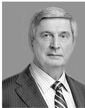
Иван Иванович МЕЛЬНИКОВ - первый заместитель Председателя ЦК КПРФ, первый заместитель председателя Госдумы РФ по контролю и регламенту.