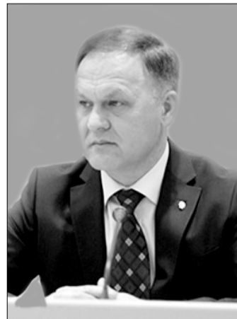
Виктор Иванович ЛОЗОВОЙ - член Президиума ЦКРК КПРФ, второй секретарь крайкома КПРФ, депутат Думы Ставропольского края.