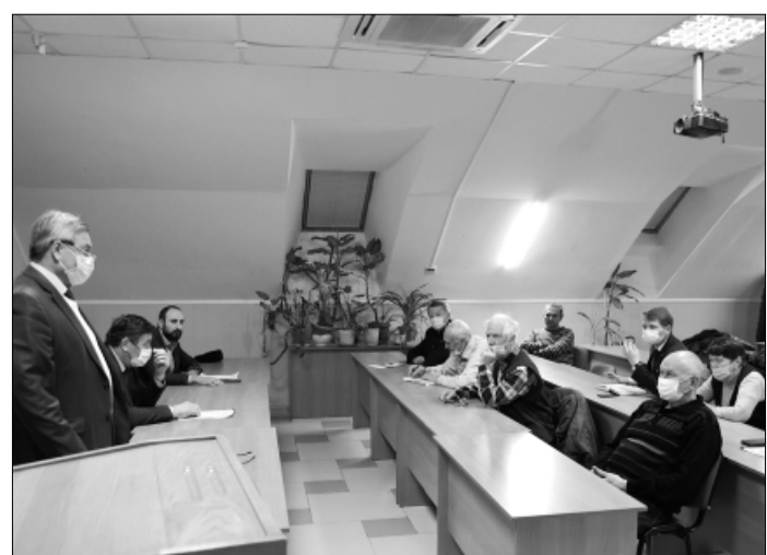
Круглый стол в крайкоме КПРФ

КПРФ не поддержала либеральную оппозицию на митингах «за Навального». У партии есть своя дорога в большой политике. Совсем скоро по всей России коммунисты выступят с критикой действующего курса власти, экономической и социальной политики государства, а также потребуют назначить Правительство народного доверия.