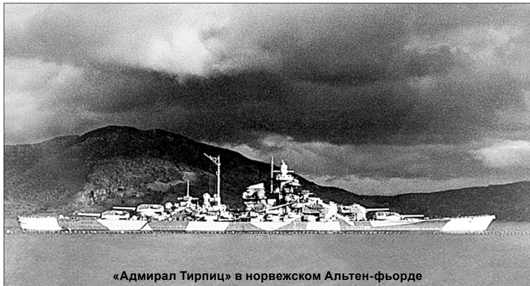
«Адмирал Тирпиц» в норвежском Альтен-фьорде

В моей семье хранится самая дорогая память об отце - очерк-исследование журналиста А. Ткачёва «Охота на «Тирпица». Он был опубликован в 1984 году в журнале «Наш современник». В нём автор открывает малоизвестную страницу Великой Отечественной войны: противостояние союзных морских транспортных конвоев мощнейшим силам фашистской Германии.