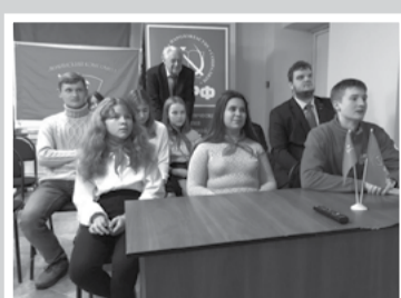
Партийная жизнь – стр. 2