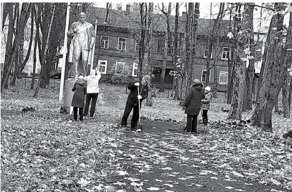
Валдайский Райком КПРФ организовал субботник в городском сквере, где установлен памятник В.И. Ленину.