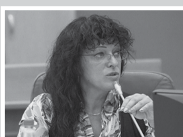
Фракция КПРФ – стр. 3