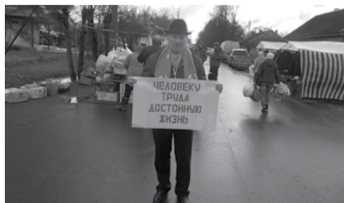
В Холме Райком КПРФ организовал проведение одиночных пикетов.