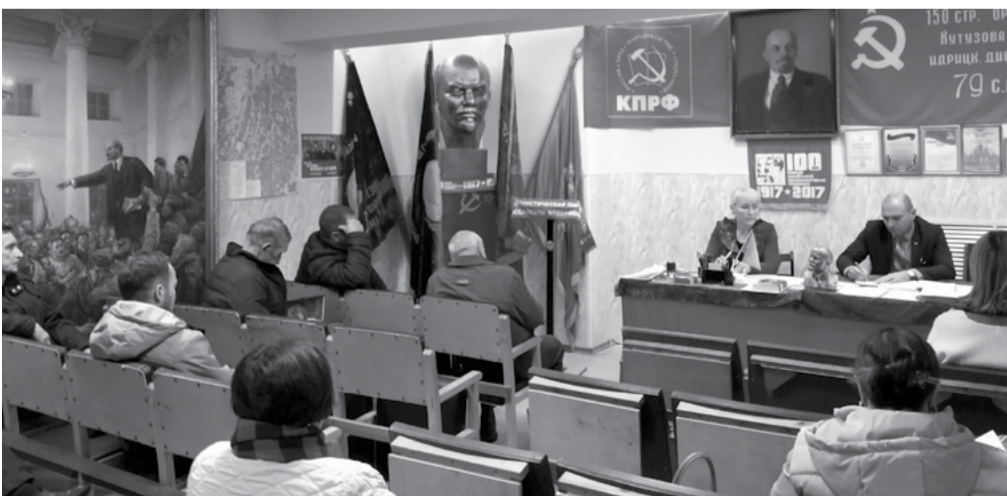
В Старой Руссе торжественно открыли новый офис райкома КПРФ, расположенный на главной площади города.