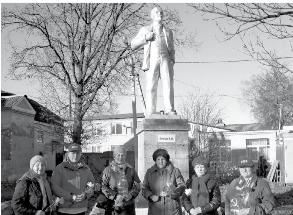
В Сольцах активисты местной организации КПРФ 7 ноября собрались у памятника Ленину.