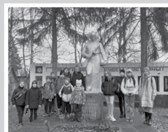
Из почты редакции – стр. 7