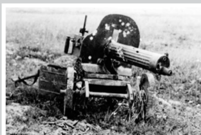
О легендарном пулеметчике – стр. 6