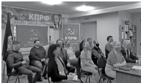
Коллективный просмотр Торжественного заседания, посвященного 103-й годовщине Великого Октября.