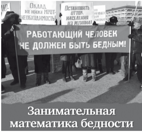
Занимательная математика бедности

Читаем РБК и даёмся диву чиновничьей наглости и отрыву от реальности. Глава Счётной палаты РФ Алексей Кудрин отчитался, что в России побороли нищету.