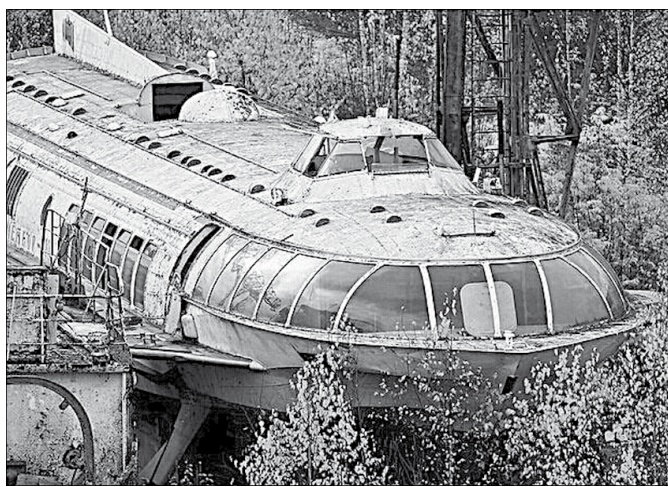
После развала Советского Союза до сих пор находят брошенные «галюши»

Президент России Владимир Путин в свой день рождения признался, что ему нравятся многие ценности левого толка, которые он сравнил с христианскими. «Равенство, братство, чего ж здесь плохого?» - сказал он.