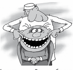
Мы заставим Вас улыбаться!

От редакции. Эту статью можно найти в Интернете. Мы её даём с небольшими сокращениями и с одной принципиальной оговоркой. Вроде бы, всё в ней правильно написано, кроме вывода. Что-де и КГБ остался, и КПСС осталась. Так почему же тогда всё изменилось, если главное - осталось? Потому что всё наоборот: сначала убили КГБ и КПСС, а уж потом произошёл распад СССР.