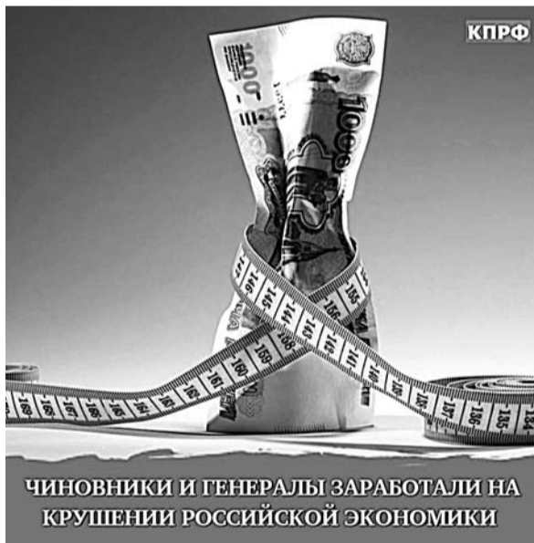
ЧИНОВНИКИ И ГЕНЕРАЛЫ ЗАРАБОТАЛИ НА КРУШЕНИИ РОССИЙСКОЙ ЭКОНОМИКИ

Статья «общегосударственные вопросы», в которую зашиты расходы на аппарат органов госвласти, увеличилась на 147 млрд рублей. Финансирование администрации президента подскочило на треть, до 19,2 млрд рублей, бюджет МИДа вырос на 20 млрд рублей, судебной системы – на 10 млрд.