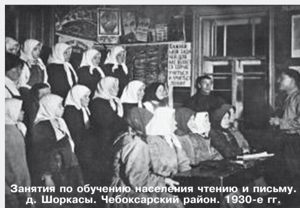
Занятия по обучению населения чтению и письму. д. Шоркасы. Чебоксарский район. 1930-е гг.

В 1922 году был проведён I Всероссийский съезд по ликвидации неграмотности. Была создана сеть «ликпунктов», где