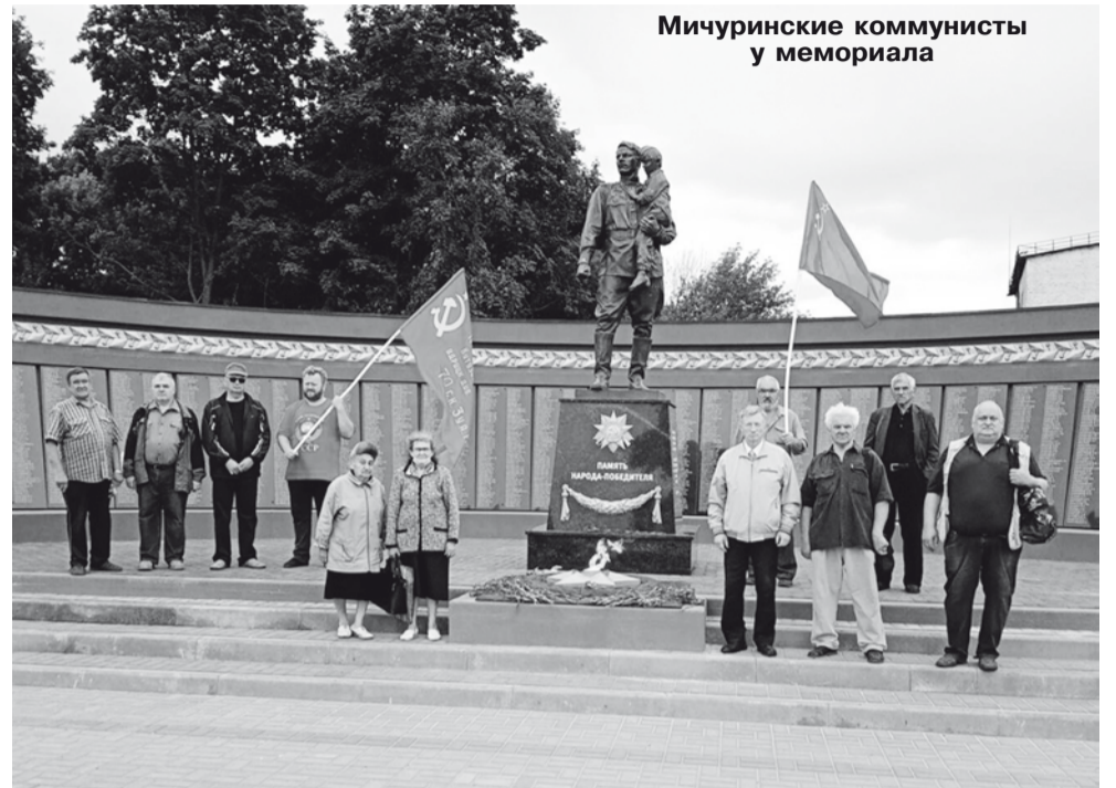
Мичуринские коммунисты у мемориала