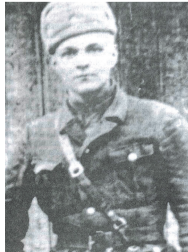
Солдат Юрий Бондарев. 1944 г.

За шестьдесят лет литературного творчества писатель опубликовал 14 романов и повестей, в том числе такие произведения, как «Горячий снег», «Берег», «Вы-