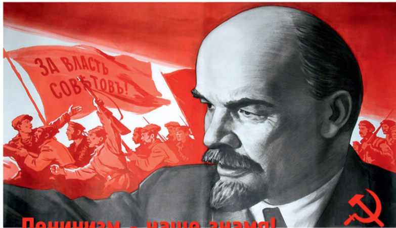
Ленинизм - наше знамя!

Напомним, по предложению сопредседателя рабочей группы по поправкам в Конституцию сенатора Андрея Клишаса Всероссийское голосование пройдет 22 апреля. Эту дату выбрали с учетом религиозных праздников: 19 апреля у православных закончится пост и они отпразднуют Пасху, а 24 апреля у мусульман начнется священный месяц Рамадан.