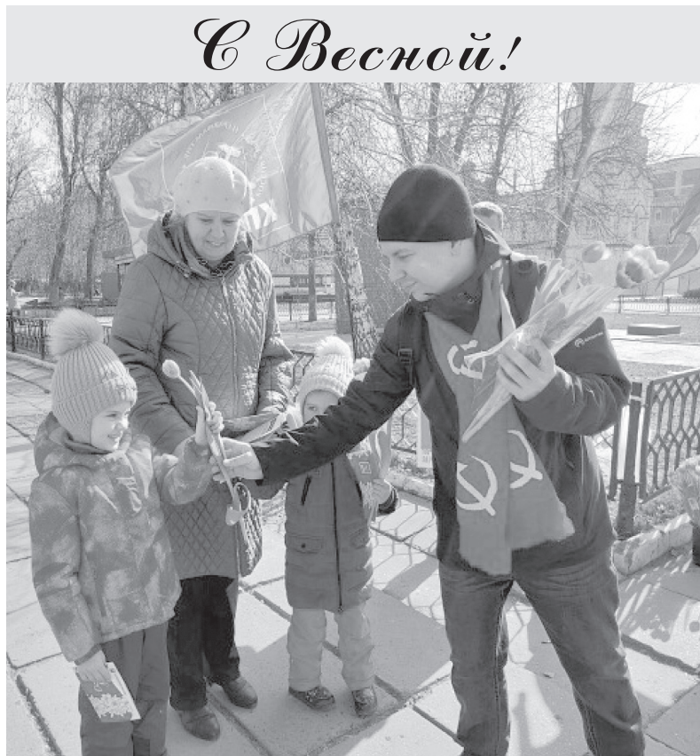
Саратовские коммунисты традиционно поздравили лучшую половину человечества с Международным женским днём 8 Марта.

Пресс-служба фракции КПРФ в Государственной Думе