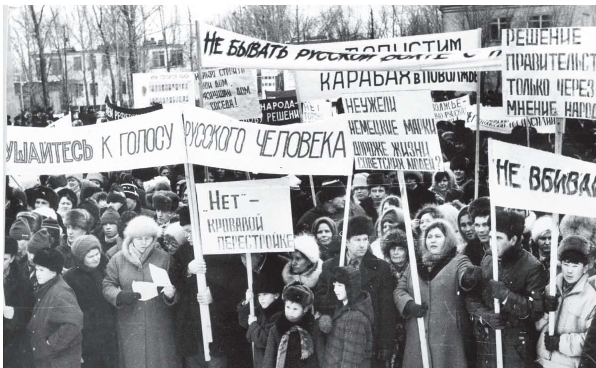
1992. Энгельс. Акция протеста против восстановления немецкой автономии в Поволжье

Учредитель и издатель: Саратовское областное отделение политической партии «КОММУНИСТИЧЕСКАЯ ПАРТИЯ РОССИЙСКОЙ ФЕДЕРАЦИИ»