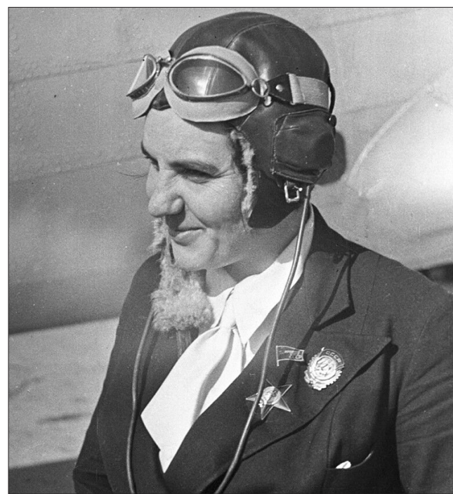
Валентина Гризодубова — советская лётчица, участница одного из рекордных перелётов, участница Великой Отечественной войны, первая женщина, удостоенная звания Героя Советского Союза

Подвиг совершали и женщины, оставшиеся в тылу —