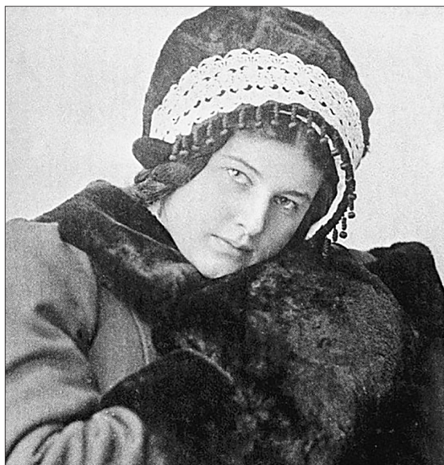
Лариса Рейснер - революционерка, «Валькирия пролетарской революции», прототип женщины-комиссара из «Оптимистической трагедии» Всеволода Вишневского

одно демократическое законодательство не сделало для женщины и половины того, что сделала Советская власть в первые же месяцы своего существования», - писал В.И. Ленин. А в 1924 году И.В. Сталин назвал женский вопрос «решающей областью работы в деле воспитания новых поколений в духе социализма».