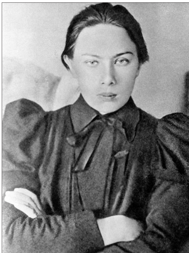
Надежда Крупская - революционерка, советский государственный, партийный, общественный и культурный деятель, организатор и главный идеолог советского образования и коммунистического воспитания молодёжи