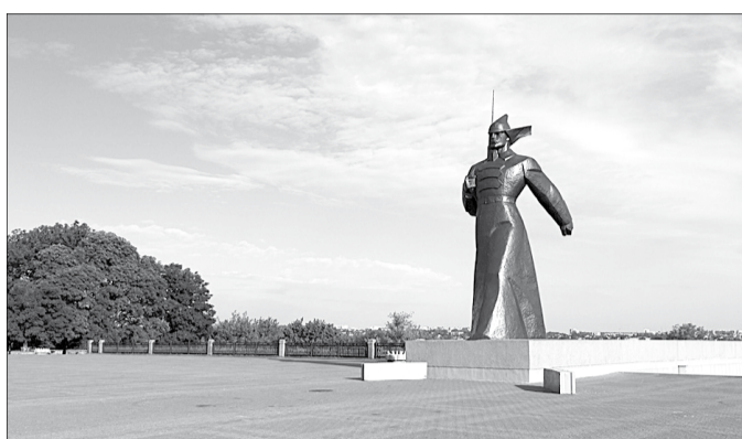
Памятник будёновцу в Ставрополе

После разгрома белоказачками Медвеженского фронта в июле 1918 года в плен попали многие защитники Советской власти, большинство из них расстреляли. Часть местных крестьян подвергли