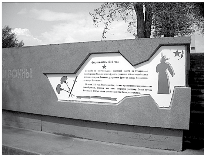
Братская могила воинов Медвеженского фронта

публичной порке шомполами на площади села Медвеженского (ныне Красногвардейское). Эту экзекуцию видел мой отец, которому в то время исполнилось 11 лет. Среди подвергнутых наказанию был его дядя, спина которого превратилась в кровавое месиво. Но тот не смирился: едва зажили раны, ушёл защищать Советскую власть и не вернулся с Гражданской войны.