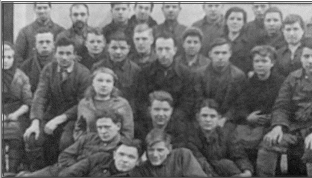
1942 год, цех № 41. Лица военной поры

Советское правительство высоко оценило трудовой подвиг фрунзенцев в годы войны. В июне 1945 года завод был награжден орденом Красного Знамени, на вечное хранение ему было вручено Красное знамя ГКО. Большая группа