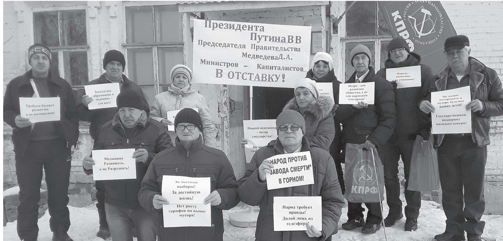
Пресс-служба Новобурасского райкома КПРФ

«Бесплатное образование и медицина — для всех!», «Государственную поддержку — молодым семьям!», «За честные выборы! За достойную жизнь!», «Требуем бюджет развития, а не вымирания!», «Народ требует правды! Долой ложь из телевизора!» Акция будет продолжена.