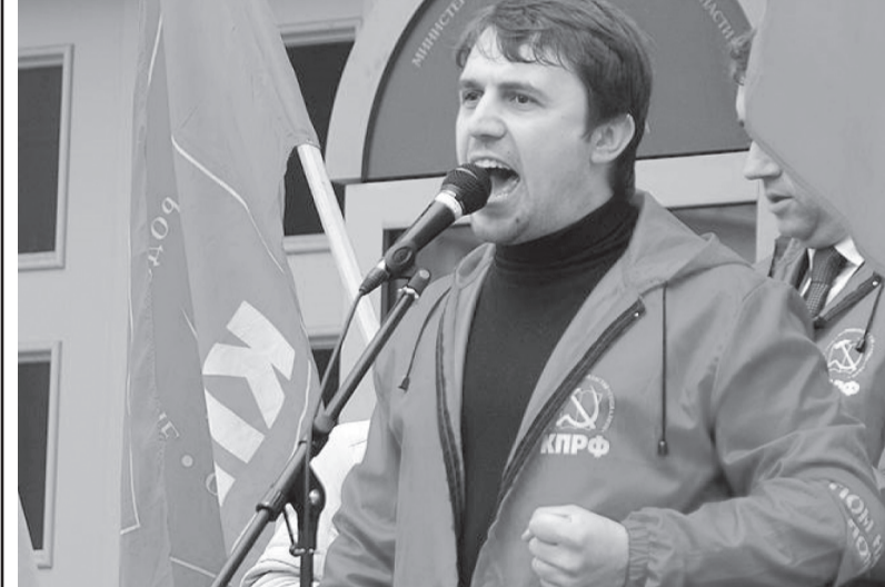
Валентин ЧИКИН, главный редактор газеты «Советская Россия»

Всем — новым соратникам, дорогим читателям — здоровья, жизненных радостей!