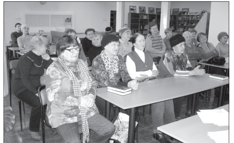
В читальном зале библиотеки.