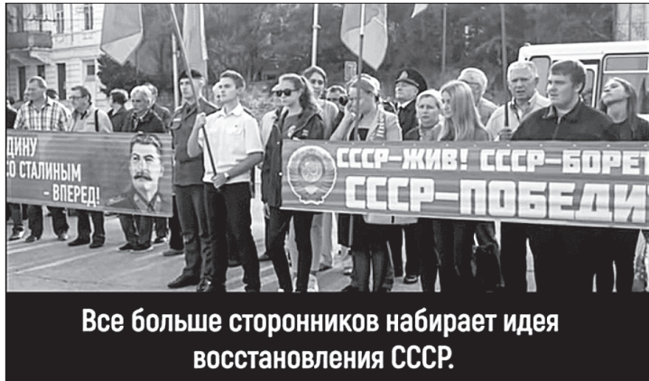
Все больше сторонников набирает идея восстановления СССР.

Вот некоторые примеры из того, что можно найти в Интернете. Некто Г. Малыгин пишет: «Вспоминая лето 1984 года в деревне, я понимаю только теперь, что это и было Счастье. Все вместе такие родные: живые и здоровые. Дяди и тети, братья и сёстры, бабушки и дедушки. И нет ещё никаких «перестроек и ускорений», «лихих 90-х» и всей прочей дряни. Простое советское Счастье с клубничкой в озерце, удочкой на речке, бабушкиными блинчиками и грибами в лесу. Когда на столе картошечка с селедкой, мороженое и лимонад, песни до утра да купанье в маленькой чистой речке. Тогда мы этого не понимали, потому что не было у