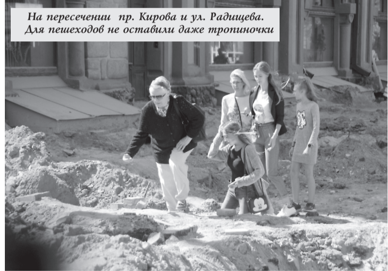
На пересечении пр. Кирова и ул. Радищева. Для пешеходов не оставили даже тротиньки

«Мы пустили кабели. Там и связи, и всего остального — большой пучок», — ответил он, показав, что готовится щелбенка для засыпки раскопанной