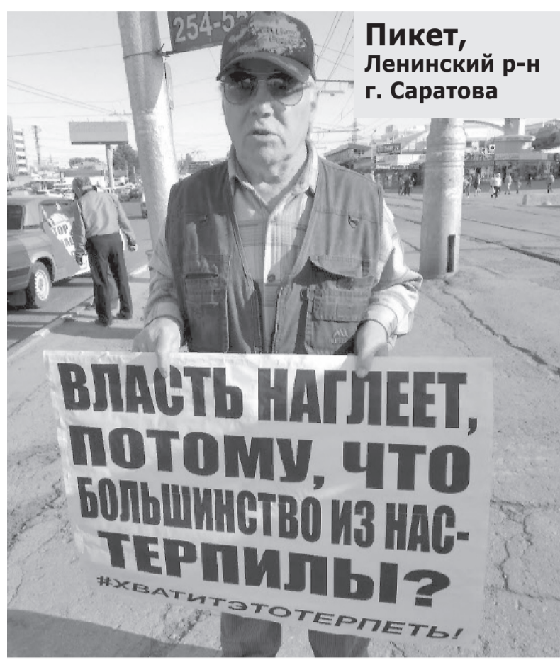
Пикет, Ленинский р-н г. Саратова

С уважением, Г.А. ЗЮГАНОВ, Председатель ЦК КПРФ, руководитель фракции КПРФ в Государственной Думе ФС РФ