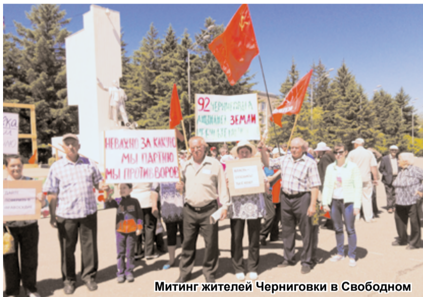
Митинг жителей Черниговки в Свободном

На фоне этих событий начались подвижки и в арбитражных судах. Руководство ГПЗ пошло на мировое соглашение (строительство на чужих землях уже идет, а исполнение судебного решения может в будущем влететь в копеечку). Юристы гиганта-госкорпорации не удостоверялись в чистоте сделки при приобретении участков и решили не доводить до цугундера. Правда сначала филиал «национального достояния» посулил черниговцам за один земельный пай и отзыв исков по другим участкам, которые оказались в собственности у третьих лиц (ТОР «Лесозаводский», «Газпром переработка», «Газохимический комплекс»), по 250 тысяч рублей – четверть реальной стоимости земли. Но жители, зная, что на их стороне правое дело, не согласились на