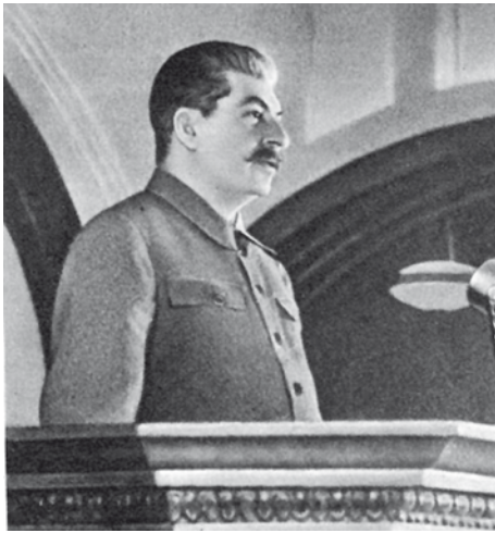
Академик И.П. Бардин: (Окончание. Начало см. в №№ 32-33)

пуска в работу и разрабатывали чертежи для новых цехов, создаваемых на базе прибывающих с запада агрегатов. Это оборудование устанавливалось и пускалось в работу в той очерёдности, которая определялась потребностями оборонных заводов в тех или других видах металла. Иногда, чтобы дать место важнейшим прокатным станам (изготавливающим броню для танков, стальные трубы больших диаметров и др.), приходилось даже демонтировать на восточных заводах оборудование, не имеющее прямого оборонного значения, и быстро, в 1,5-2 месяца, на его месте устанавливать и пускать в действие прибывшее с запада.