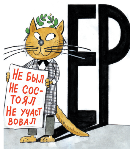
Рисунок Вячеслава Полухина

В ряде округов на кандидатов от КПРФ и их сторонников оказывается силовое давление.