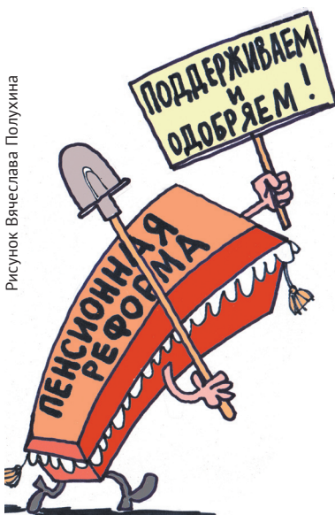
Рисунок Вячеслава Полухина

Хаотичная застройка столичного пространства ведётся сугубо