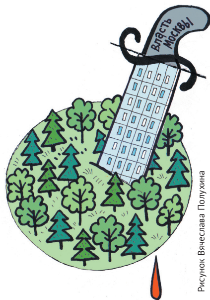
Рисунок Вячеслава Полухина