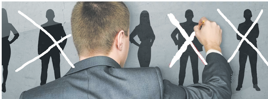
Коллаж Дмитрия Малкина

В чем проявляется уважение? В первую очередь, в умении слышать собеседника. Вот, например, такая ситуация: человек приходит в магазин и просит продать ему пачку печенья, а продавщица протягивает ему упаковку пряников. При этом в ответ на справедливое возмущение покупателя отвечает, что заботится о достатке покупателя и не может продать ему более дорогое печенье, когда и пряники вполне неплохи.