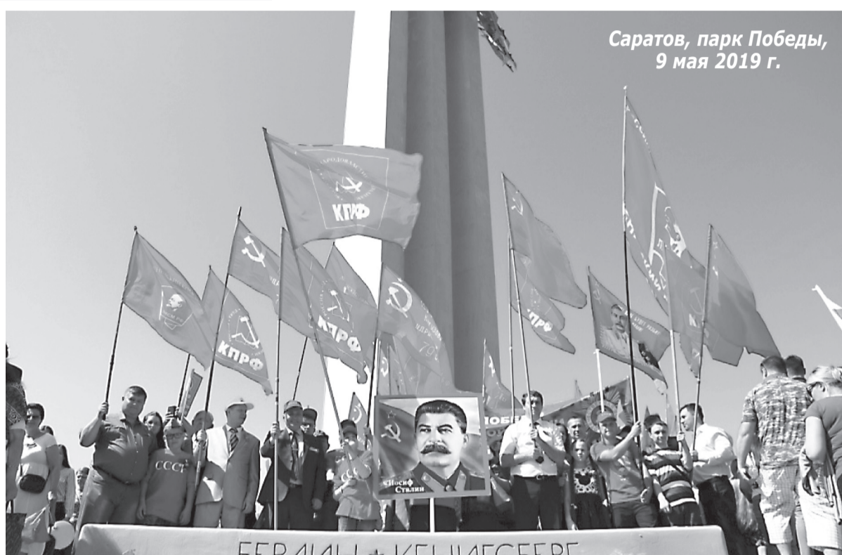
Саратов, парк Победы, 9 мая 2019 г.

— В нашей стране ежегодно накануне Дня Победы приходится видеть и слышать что-то «новое», отдающее фальшью о Великой Отечественной войне, распространяются вымыслы о нечестности советских солдат, граждан. Не исключено, что в преддверии 75-летия Великой Победы будут муссироваться по-