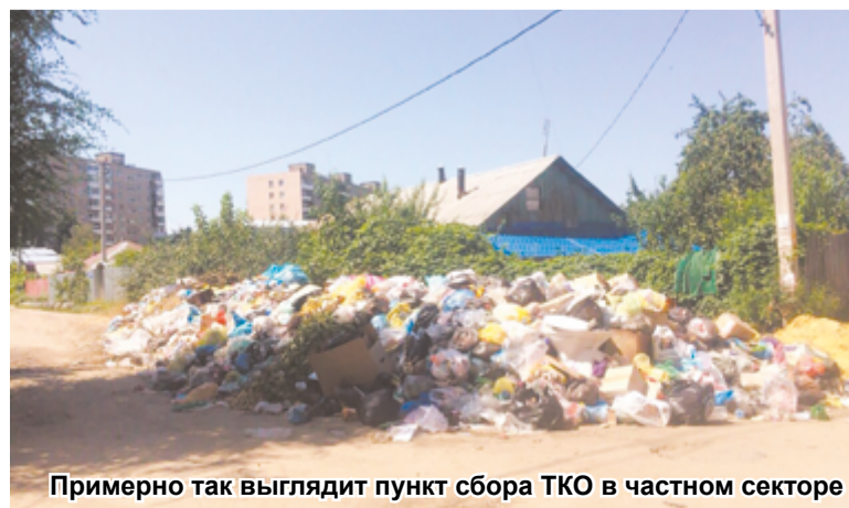
Примерно так выглядит пункт сбора ТКО в частном секторе

типовой договор и право потребителя в выборе способа учета ТКО. Амурским УФАС выдано предупреждение о прекращении действий, содержащих признаки нарушения антимонопольного законодательства. Согласно постановлению Правительства РФ №1156, договор необходимо составлять с учетом права потребителя на выбор способа определения объема отходов (исходя из нормативов накопления или фактического объема). Также антимонопольщики указали, что в договоре необходимо устанавливать конкретные даты вывоза мусора. Пока региональному оператору «СпецЭкоМаш», работающему в Зее и Зейском районе, дали время на устранение нарушений законодательства. Так что у амурчан есть шансы добиться составления нового договора, на более справедливых условиях.