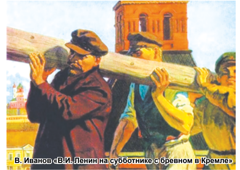
В. Иванов «В.И. Ленин на субботнике с бревном в Кремле»

Память о первом коммунистическом субботнике живёт в народе по сей день. Естественно, что содержание нынешнего субботника имеет существенное отличие от содержания субботников советских времён. Если в советское время субботники наиболее часто проводились на рабочих местах, что обеспечивало или дополнительный выпуск продукции, необходимой народному хозяйству, или проведение ремонта и обновление производственных фондов в целях дальнейшего роста объёмов и улучшения качества выпускаемой продукции, или другие мероприятия, дающие экономический эффект, то сегодня субботники ограничиваются благоустройством территорий. Такие локальные уборки, организованные коммунистами и комсомольцами – дань памяти советскому прошлому и часть классовой борьбы с действующей властью капитала. Это наглядное противопоставление принципов коммунистической солидарности принципам капиталистической наживы и буржуазного мещанства. Об этих акциях не принято рассказывать в СМИ, не исклю-