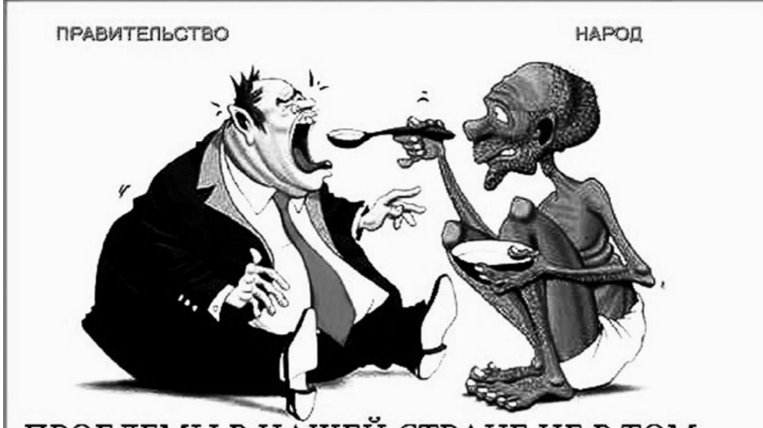
ПРОБЛЕМЫ В НАШЕЙ СТРАНЕ НЕ В ТОМ, ЧТО МЫ НЕ МОЖЕМ НАКОРМИТЬ БЕДНЫХ, А В ТОМ, ЧТО БОГАТЫЕ НЕ МОГУТ ВСЁ НИКАК НАЖРАТЬСЯ...

В какой ещё стране можно безнаказанно осуществить подобное разграбление? Россию грабили не только изнутри, но и извне.