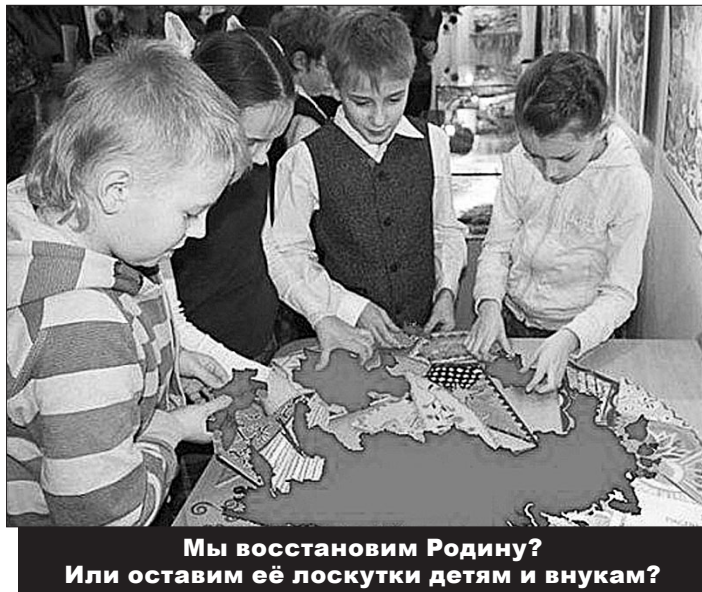
Мы восстановим Родину? Или оставим её лоскутки детям и внукам?

Но в целом экономика развивалась, работали бы заводы и фабрики, их бы никто не выкупил и не разрушил. Не было бы такой бедности, удалось бы избежать сокращения населения. Каждый работал, получал квартиры, которые находились в собственности государства, а это значит, что мошенничество в сфере недвижимости было бы сведено к минимуму. Инфляция