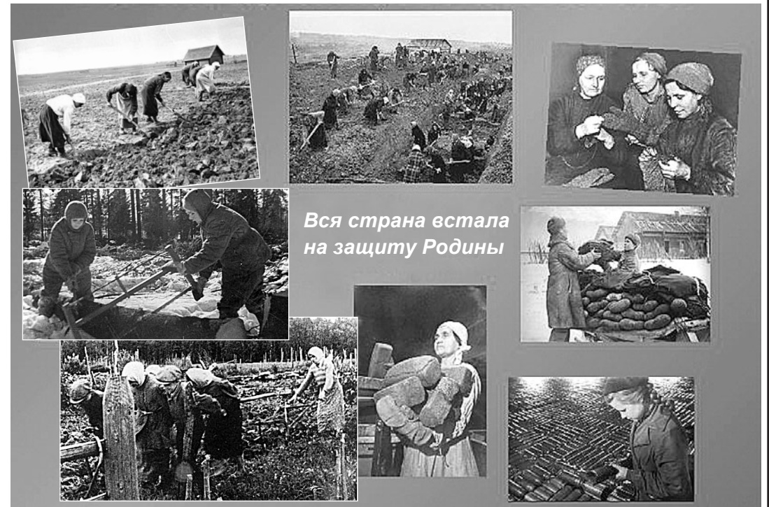
Вся страна встала на защиту Родины

Уважаемая редакция газеты «Родина», здравствуйте! Сейчас я живу в США, но сердце моё всегда принадлежало и принадлежит советским женщинам – труженицам сельского хозяйства Ставрополья. Хочу рассказать об их гражданском подвиге в годы Великой Отечественной войны.