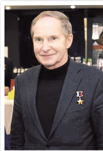
Герой России космонавт Валерий Токарев

навтов. Проходил подготовку в Космическом центре Джонсона, в составе экипажа шаттла «Дискавери». В мае 1999г. совершил свой первый космический полет, побывав на МКС. С 1 октября 2005г. по 8 апреля 2006 г. совершил свой второй космический полет в качестве командира корабля «Союз ТМА-7» и бортинженера экипажа МКС. Произвел два выхода в открытый космос, установив рекорд пребывания в открытом пространстве: 11 час.5 мин. Продолжительность полета составила 189 суток 19 час.