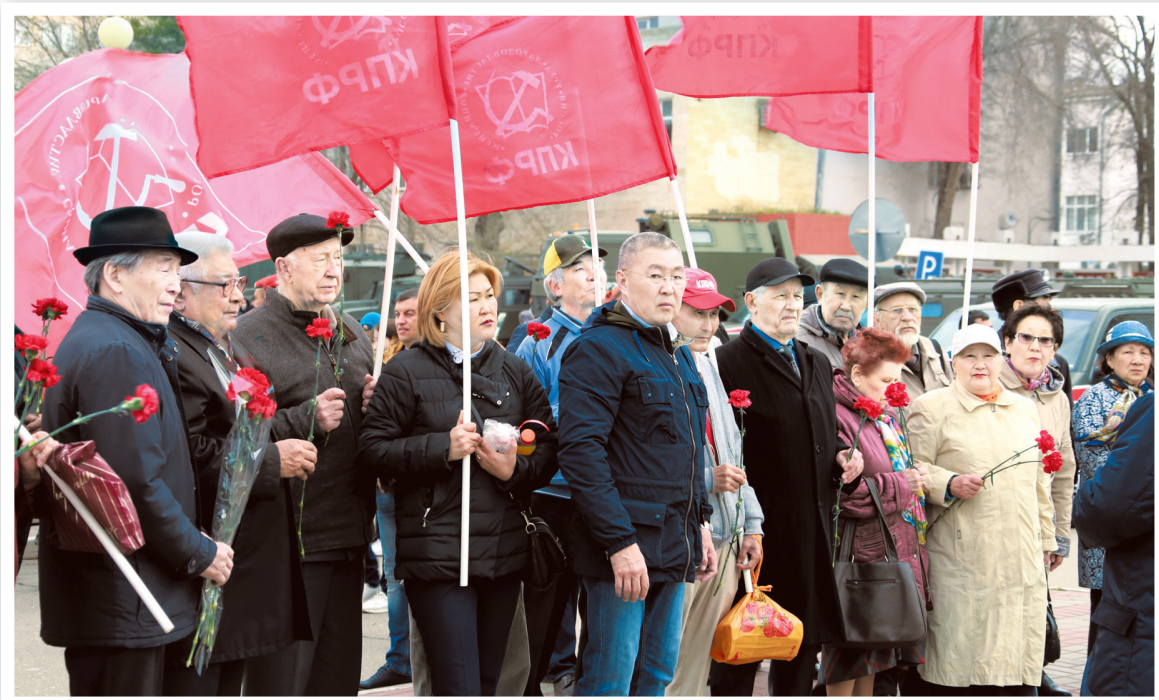
Митинг у памятника В.И. Ленину в Элисте

22 апреля, в 149-ю годовщину со дня рождения Владимира Ильича Ленина, коммунисты Калмыкии совместно со своими сторонниками из ООО «Дети войны», ВЖС «Надежда России», ВСД «Русский Лад» и других общественных организаций провели торжественное возложение цветов к памятникам основоположнику Компартии и Советского государства.