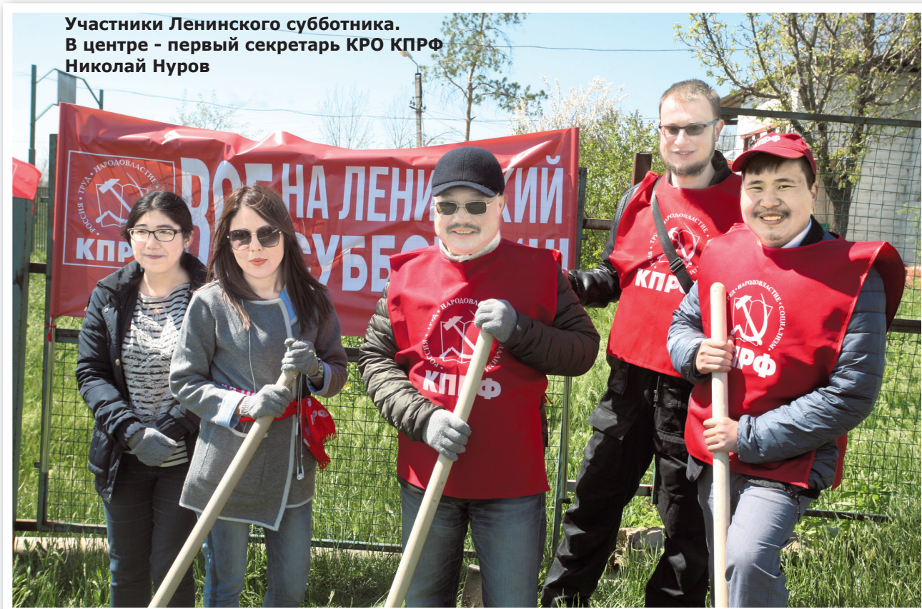
Участники Ленинского субботника. В центре - первый секретарь КРО КПРФ Николай Нуров