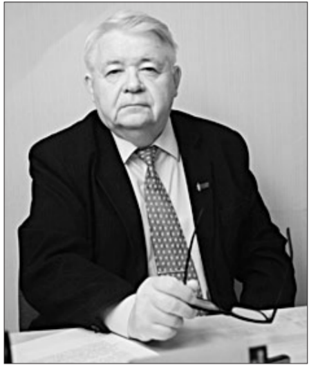
(Окончание. Начало на 1-й стр.)

Среднему поколению придавала смысл бытия, который состоял и состоит в борьбе за восстановление Советской власти в стране. Нужно высоко нести знамя борьбы с уверенностью, что его подхватят более молодые и сильные руки.