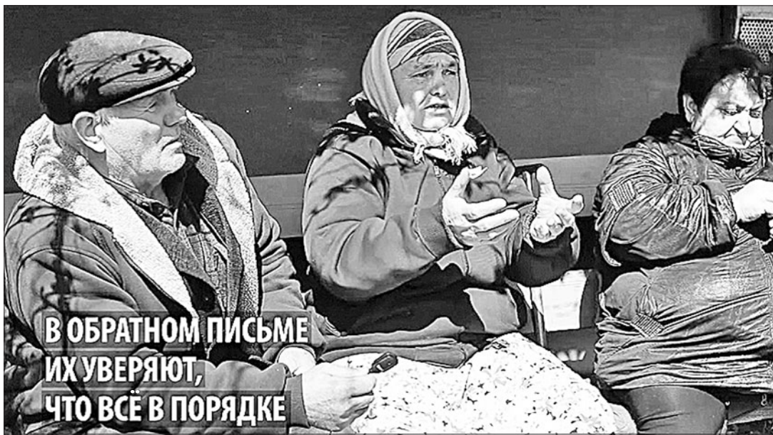
В ОБРАТНОМ ПИСЬМЕ ИХ УВЕРЯЮТ, ЧТО ВСЕ В ПОРЯДКЕ

После обещания администрации организовать пайщикам встречу с руководством края сельчане действительно прекратили акцию, но от намерения возобновить её в случае очередного обмана не отказываются. В своём заявлении они заранее возложили ответственность за негативные или даже трагические последствия голодовки на губернатора Ставрополья Владимира Владимировича.