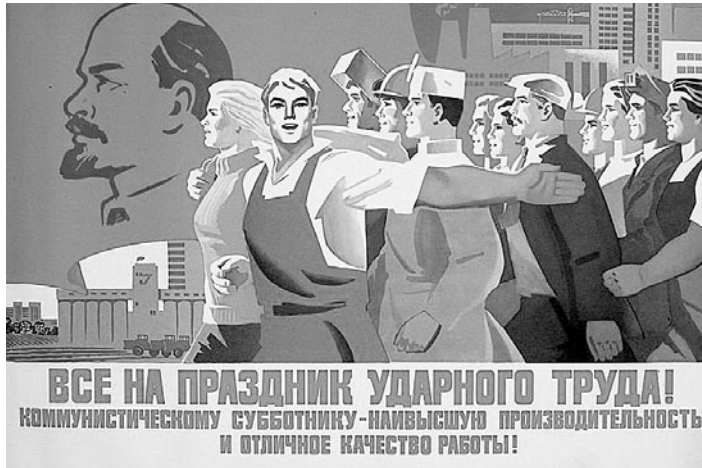
ВСЕ НА ПРАЗДНИК УДАРНОГО ТРУДА! КОММУНИСТИЧЕСКОМУ СУББОТНИКУ-НАИБОЛЬШУЮ ПРОИЗВОДИТЕЛЬНОСТЬ И УЛУЧШЕНИЕ КАЧЕСТВА РАБОТЫ!

Сто лет назад тринадцать железнодорожников-коммунистов и двое беспартийных дело Москва-Сортировочная организовали субботник и бесплатно отремонтировали три паровоза Ов-7024, Чн-358 и V-504, которые срочно требовались для отправки на фронт.