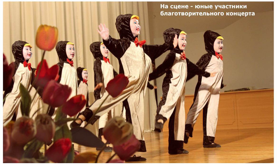
На сцене - юные участники благотворительного концерта