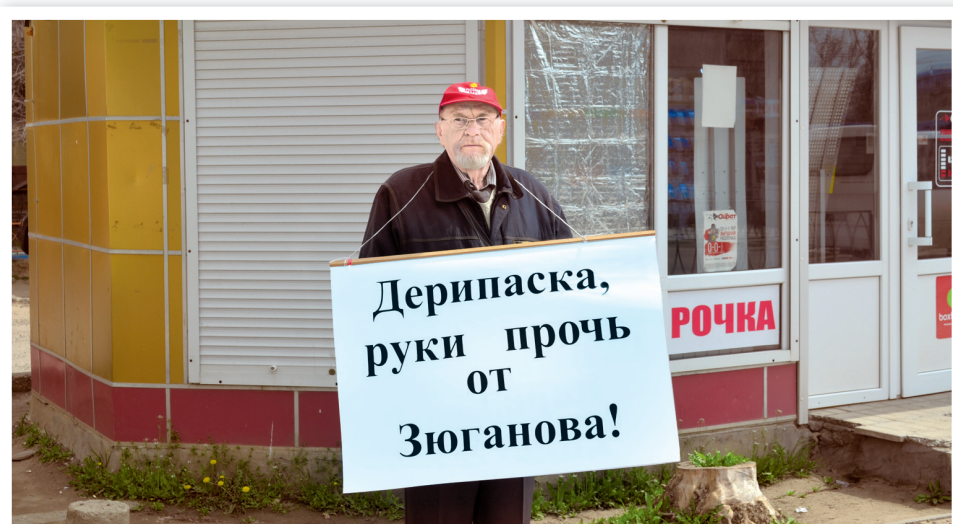
Пикет в центре Элисты

- Мы целиком и полностью на стороне Геннадия Андреевича Зюганова,