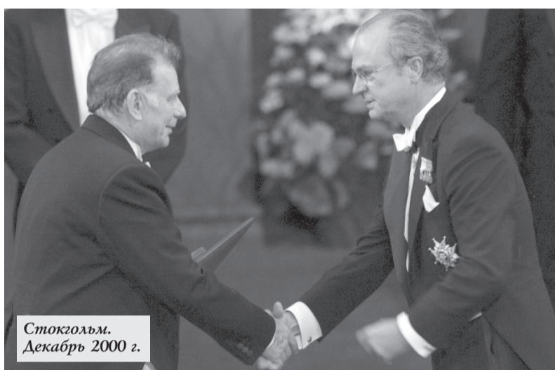
Стокгольм. Декабрь 2000 г.

Именно за создание гетероструктур, применяемых в высокочастотных схемах и оптоэлектронике, Алфёров вместе с немцем Гербертом Крёмером получил в 2000 году Нобелевскую премию по физике. На этом учёный не успокоился. Последние десятилетия он посвятил созданию