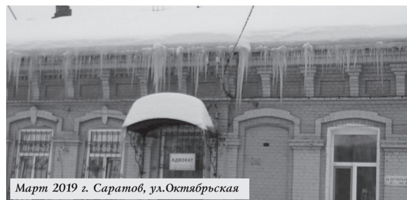
Март 2019 г. Саратов, ул. Октябрьская

Но система не работает. Руководители управляющих