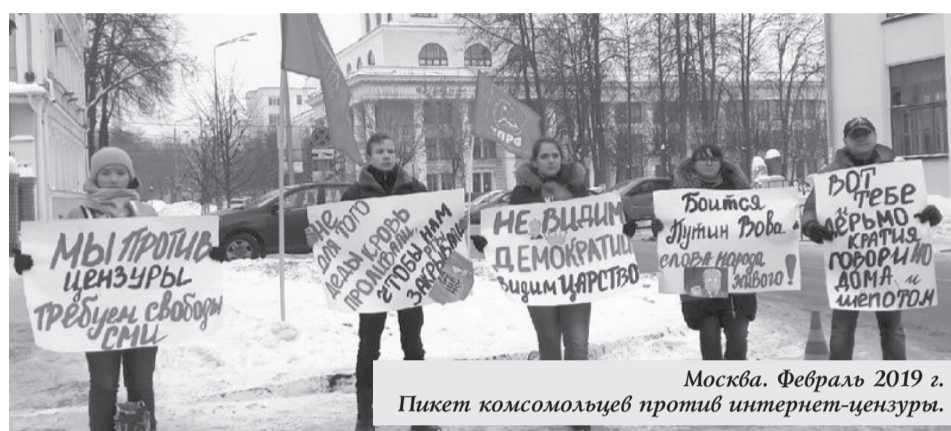
Москва. Февраль 2019 г. Пикет комсомольцев против интернет-цензуры.

как он устанавливает ответственность за распространение в сети интернет информации, выражающей в неприличной форме явное неуважение к органам, осуществляющим государственную власть. Ключевым здесь является термин «неприличная форма», он предполагает, прежде всего, всякого рода вульгарные фразы. Я накануне сидел со словарями и набрал несколько сот слов в нашем русском языке, которые могут считаться неприличными. Они очень часто употребляются в обиходе гражданами, но это не является нецензурной бранью. Так вот, в неприличной форме может быть выражена и обычная лексика, нормативная лексика, вот дело-то в чем. Поэтому термин «неприличная форма» — это очень неопределенный термин, его ни в коем случае нельзя здесь употреблять, и он, конечно же, ведет к ограничению критики. Такая норма ведет к ограничению критики органов, которые осуществляют государственную власть, прежде всего на местах. Нам говорят, что этот термин, эта диспозиция