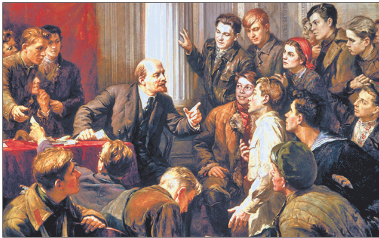
П.П. Белоусов «Ленин среди делегатов III съезда РКСМ»

Большинство делегатов почувствовало облегчение. Учиться коммунизму — это понятнее, чем просто учиться. Но почему «каза-