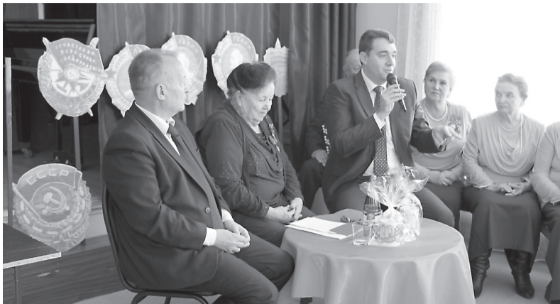
В поселке Ровное отпраздновали 100-летие Ленинского комсомола.