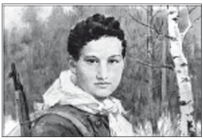
Имя Зои Анатольевны Космодемьянской (1923 – 1941) в Советском Союзе было известно каждому человеку, начиная с октябрюского возраста, нередко и ранее.