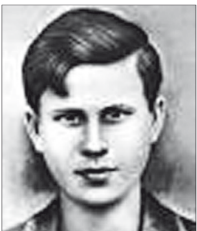
Сергей Гаврилович Тюленин