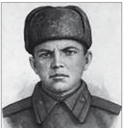
Александр Матвеевич Матросов – стрелок-автоматчик 2-го отдельного батальона 91-й отдельной Сибирской доброволь-