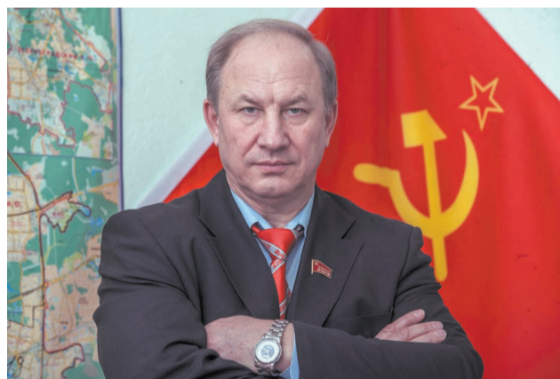
Валерий Рашкин, Первый секретарь МГК КПРФ, депутат Государственной Думы

В Московской области вообще «Единая Россия», чтобы опередить КПРФ и не дать нам возможности зарегистрироваться первыми, провела собрание «инициативной