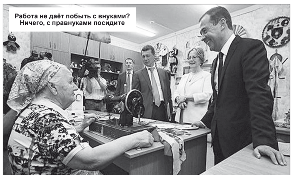
Работа не даёт побить с внуками? Ничего, с правнуками посидите