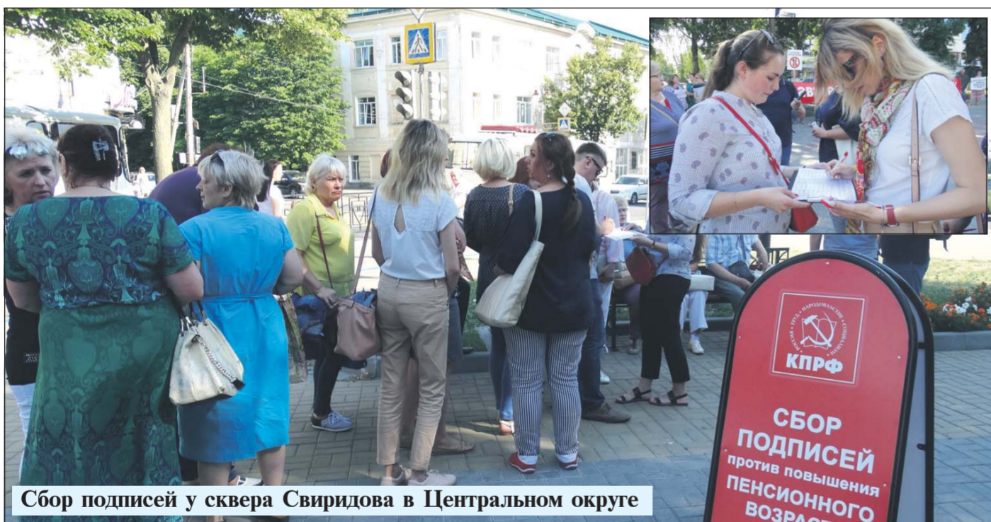
Сбор подписей у сквера Свиридова в Центральном округе

ко враг или самого себя, или страны. Часто на разных улицах областного центра можно видеть красные палатки, где идет сбор подписей.